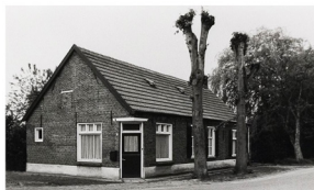
het huis en winkel van Kobus de Win