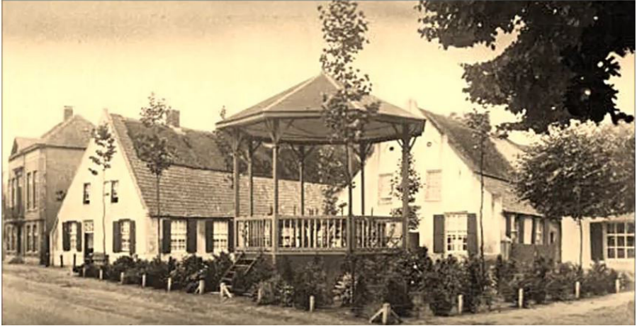
Het Marktpllein met de kiosk