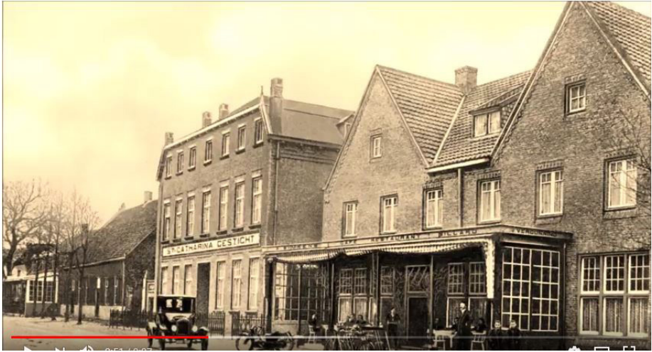
De Ster, Huize Sint Catharina, boerderij burgemeesterswoning, bondshotel De Win

woonde ernaast en was meesterknecht. Andere Leendse namen in dit