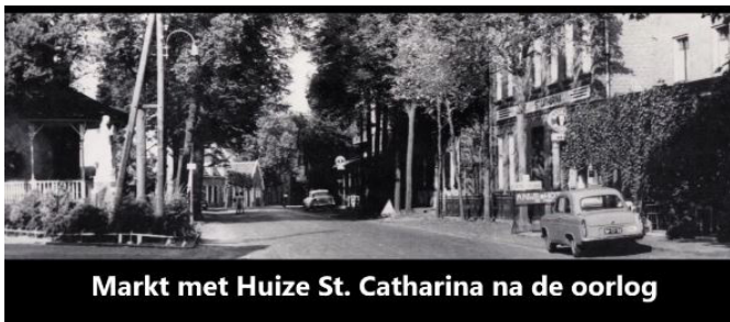
Markt met Huize St. Catharina na de oorlog