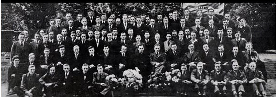
1945: Jonge Boerenbond